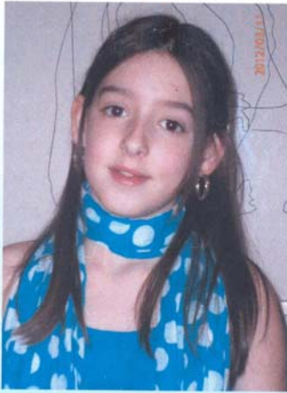
A nossa "Câmara-woman"