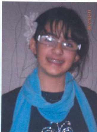
A nossa escritora