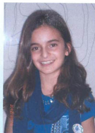
A nossa entrevistadora

As Aguadeiras da Saúde saíram à rua para entrevistar!!! Este grupo de três raparigas fantásticas resolveu fazer entrevistas a várias pessoas, de diferentes idades, para ver as diversas respostas. Conseguiram avaliar mais ou menos o que cada geração sabe e pensa sobre a água.